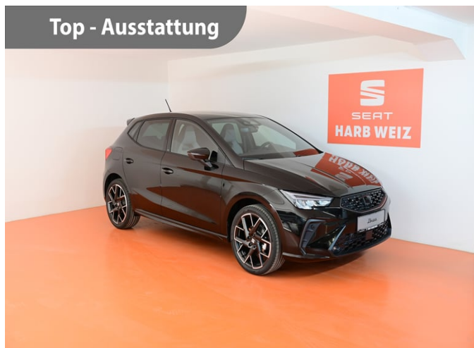
Top - Ausstattung