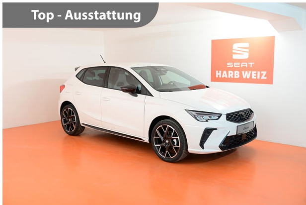
Top - Ausstattung