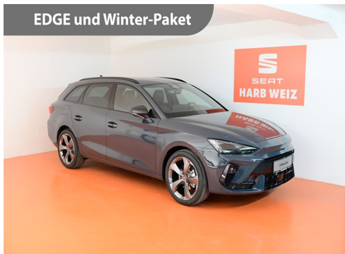
EDGE und Winter-Paket