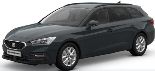
Technisch generiertes Bild. Tatsächlicher Zustand und Ausstattung können davon abweichen. Vergleichen Sie hierzu die Zustands- sowie Ausstattungsbeschreibung