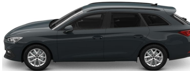
Technisch generiertes Bild. Tatsächlicher Zustand und Ausstattung können davon abweichen. Vergleichen Sie hierzu die Zustands- sowie Ausstattungsbeschreibung