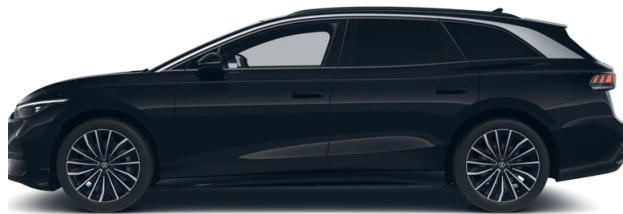
Technisch generiertes Bild. Tatsächlicher Zustand und Ausstattung können davon abweichen. Vergleichen Sie hierzu die Zustands- sowie Ausstattungsbeschreibung