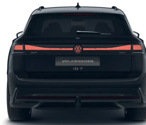
Technisch generiertes Bild. Tatsächlicher Zustand und Ausstattung können davon abweichen. Vergleichen Sie hierzu die Zustands- sowie Ausstattungsbeschreibung

Der oben genannte Preis versteht sich inkl. 20% USt. und NoVa. Abbildungen können Symbolfotos sein. Angaben über ein Fahrzeug können in Einzelfällen unvollständig sein, weshalb wir bei Interesse eine vorherige Kontaktaufnahme mit dem Verkäufer empfehlen.* CO2-Emissions-Wert Bemessung: Die angegebenen Verbrauchs und Emissionswerte wurden nach den gesetzlichen Messverfahren (VO(EG)715/2007 in der gegenwärtig geltenden Fassung) im Rahmen der Typengenehmigung des Fahrzeugs auf Basis des WLTP-Prüfverfahrens erhoben. Die Angaben beziehen sich nicht auf ein einzelnes Fahrzeug und sind nicht Bestandteil des Angebotes, sondern dienen allein Vergleichszwecken zwischen den verschiedenen Fahrzeugtypen. Der Kraftstoffverbrauch und die CO2-Emissionen eines Fahrzeugs hängen nicht nur von der effizienten Ausnutzung des Kraftstoffs durch das Fahrzeug ab, sondern werden auch vom Fahrverhalten, Fahrstrecke und anderen nicht technischen Faktoren beeinflusst. Abweichende Verbrauchswerte, CO2-Emissionen und Reichweiten können sich durch Mehrausstattungen und Zubehör (z.B. Reifen, Anhängerkupplung, Dachträger etc.) sowie Fahrstil, Geschwindigkeit, Einsatz von Komfort/Nebenverbrauchern, Außentemperatur, Anzahl Mitfahrer, Zuladung, Auswahl Fahrprofil, Topografie uvm. ergeben. Diese Faktoren beeinflussen relevante Fahrzeugparameter wie z.B. Gewicht, Rollwiderstand und Aerodynamik.